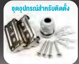
VENICE II 1S