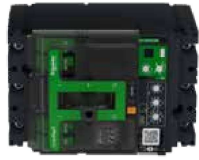
ComPact NSX ปัดตัวรีเลย์ Trip unit รุ่น Thermal-Magnetic (TM-D)