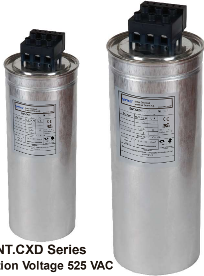
ENT.CXD Series Operation Voltage 525 VAC