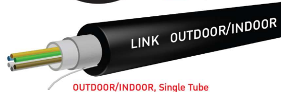
OUTDOOR/INDOOR, Single Tube UFCX3XX